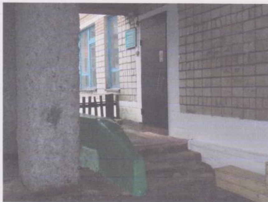
Фото № 2