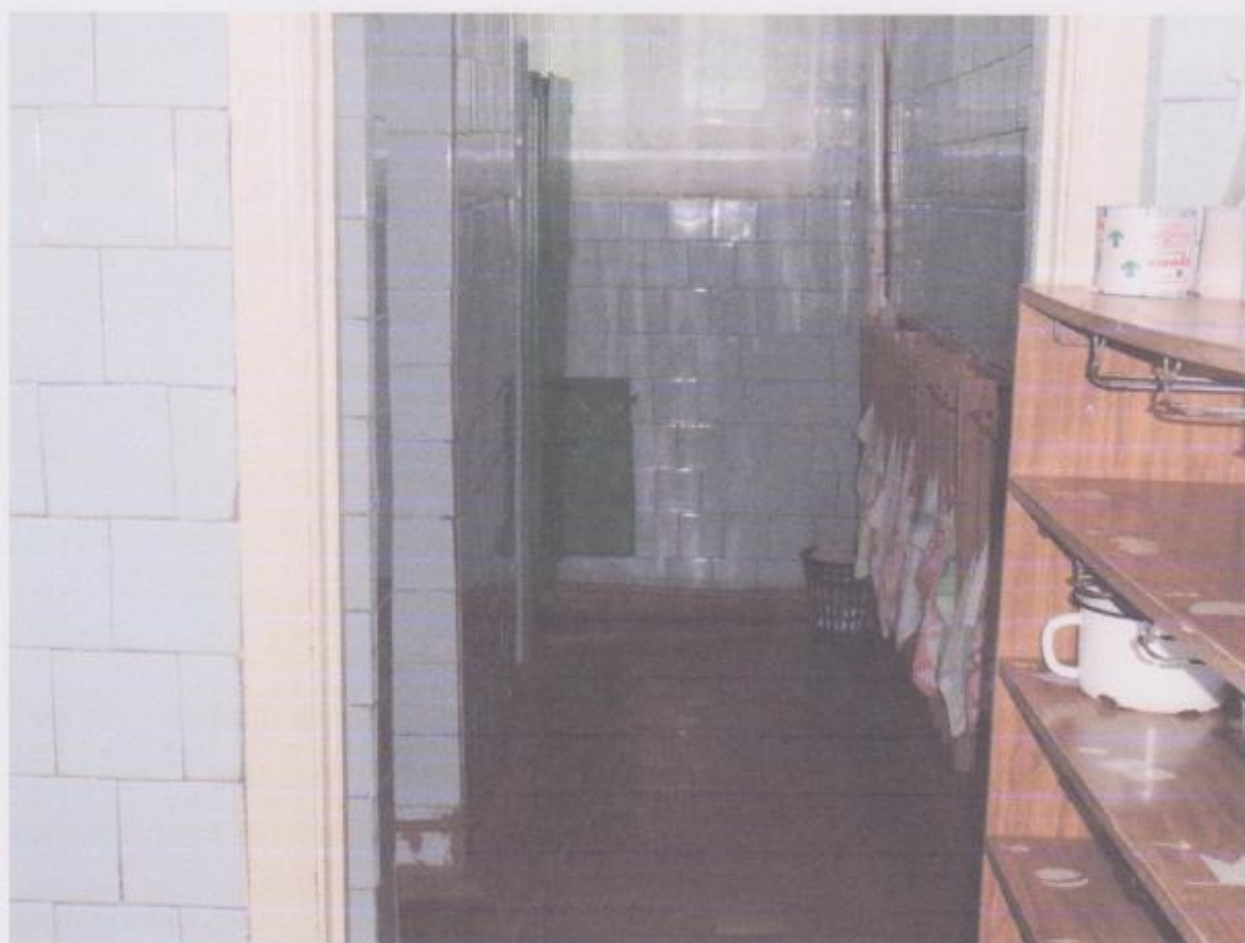
Фото № 5