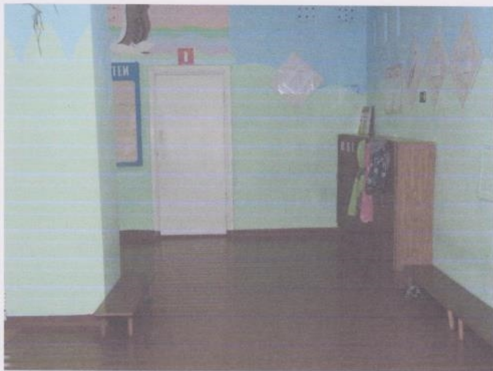
Фото № 3