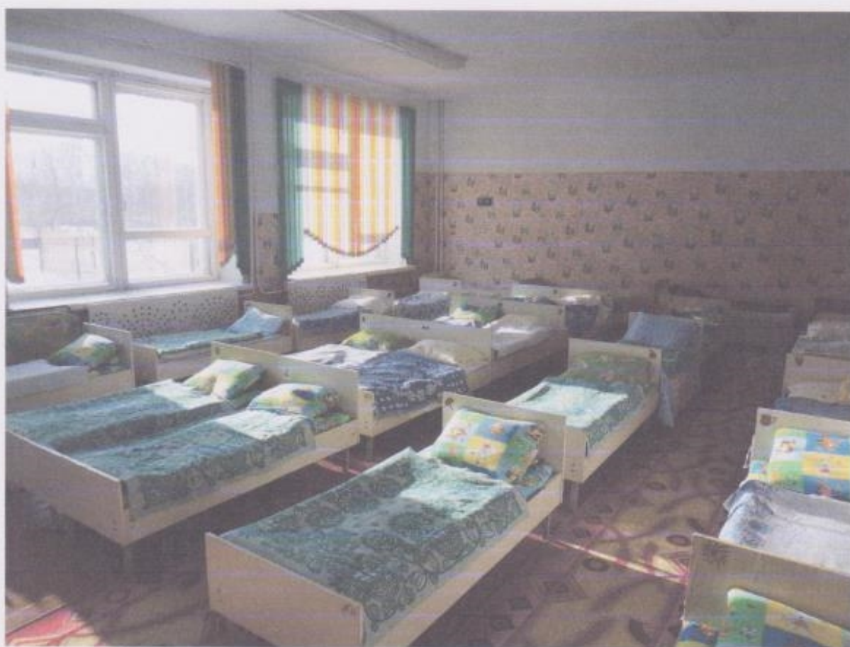
Фото № 4